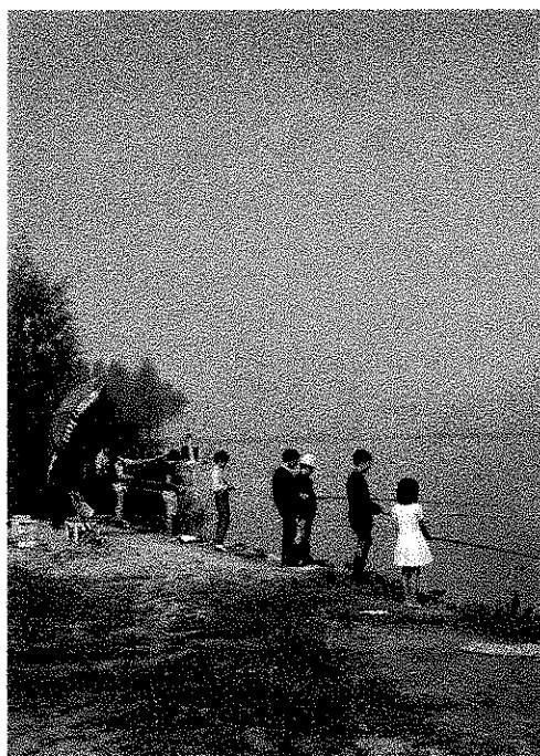
Gara di pesca in spiaggia riservata ai Pierin pescatori - figli dei soci.

Il salto qualitativo nella fornitura di servizi ai soci avviene però negli anni '90. L'APAM trasferisce il Deposito, l'Officina di emergenza, gli Uffici di movimento al Pioppone e la lontananza dalla città del punto di presa e cessazione del servizio da parte del personale delle linee extraurbane fa nascere la pressante richiesta dell'istituzione del servizio mensa. A fronte della disponibilità dell'Azienda a mettere a disposizione solamente i locali e un modesto contributo finanziario, il CRAL si assume il compito della gestione del servizio. Con uno sforzo notevole effettua gli investimenti per tutte le attrezzature di cucina e servizi mensa e per l'allestimento del bar, aperto per tutto l'arco della giornata. Ne affida la gestione a gestori privati riservandosi, però, il controllo di