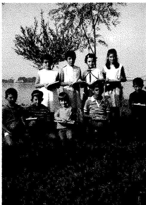
Premiazione di una gara di disegno fra i figli dei soci, nella sede estiva a Ferragosto.